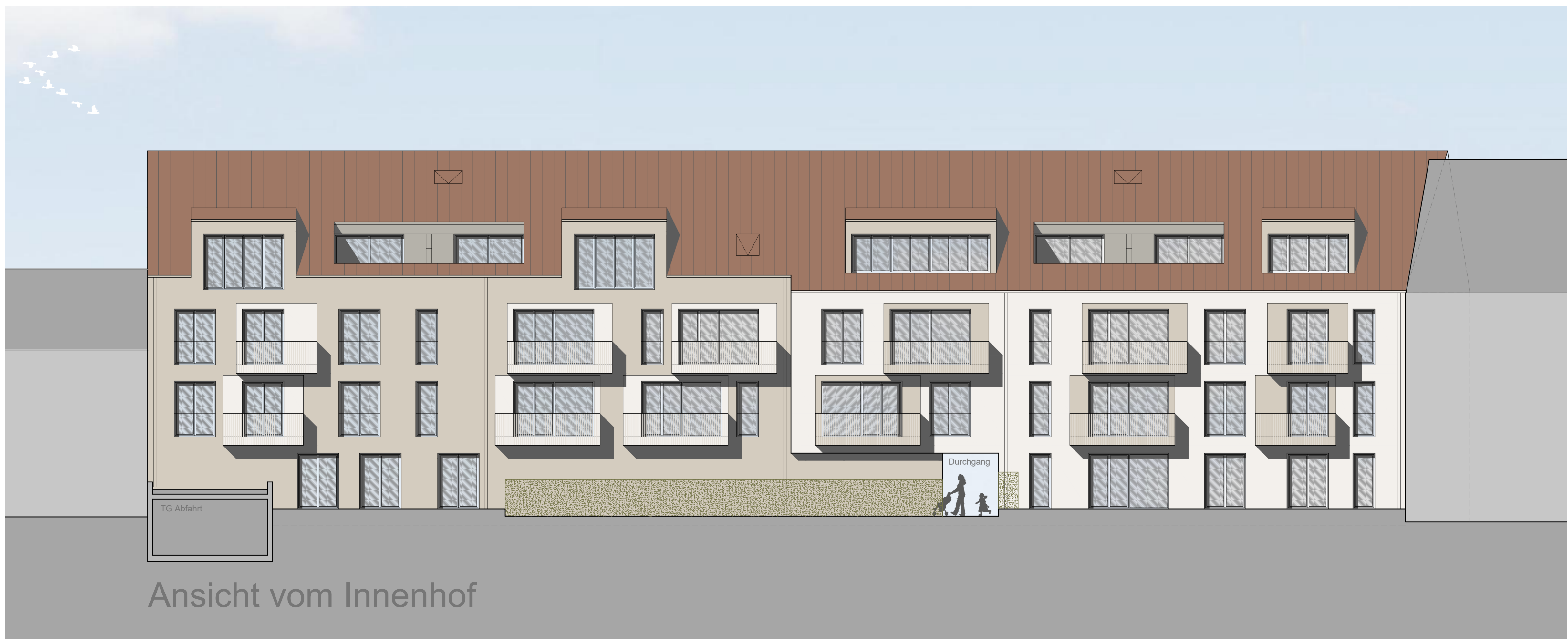
Ansicht vom Innenhof

Schlussstein Torbogen im Bereich der ehemaligen Hausnummer 21 in Fassade integriert