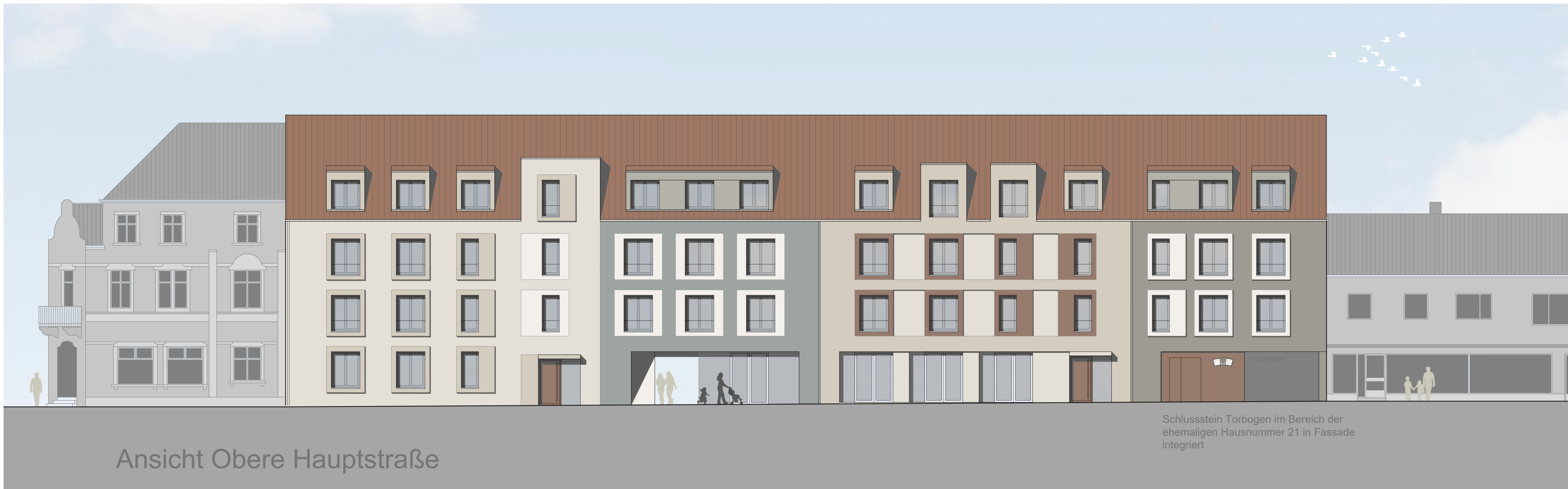
Ansicht Obere Hauptstraße

Schlussstein Torbogen im Bereich der ehemaligen Hausnummer 21 in Fassade integriert