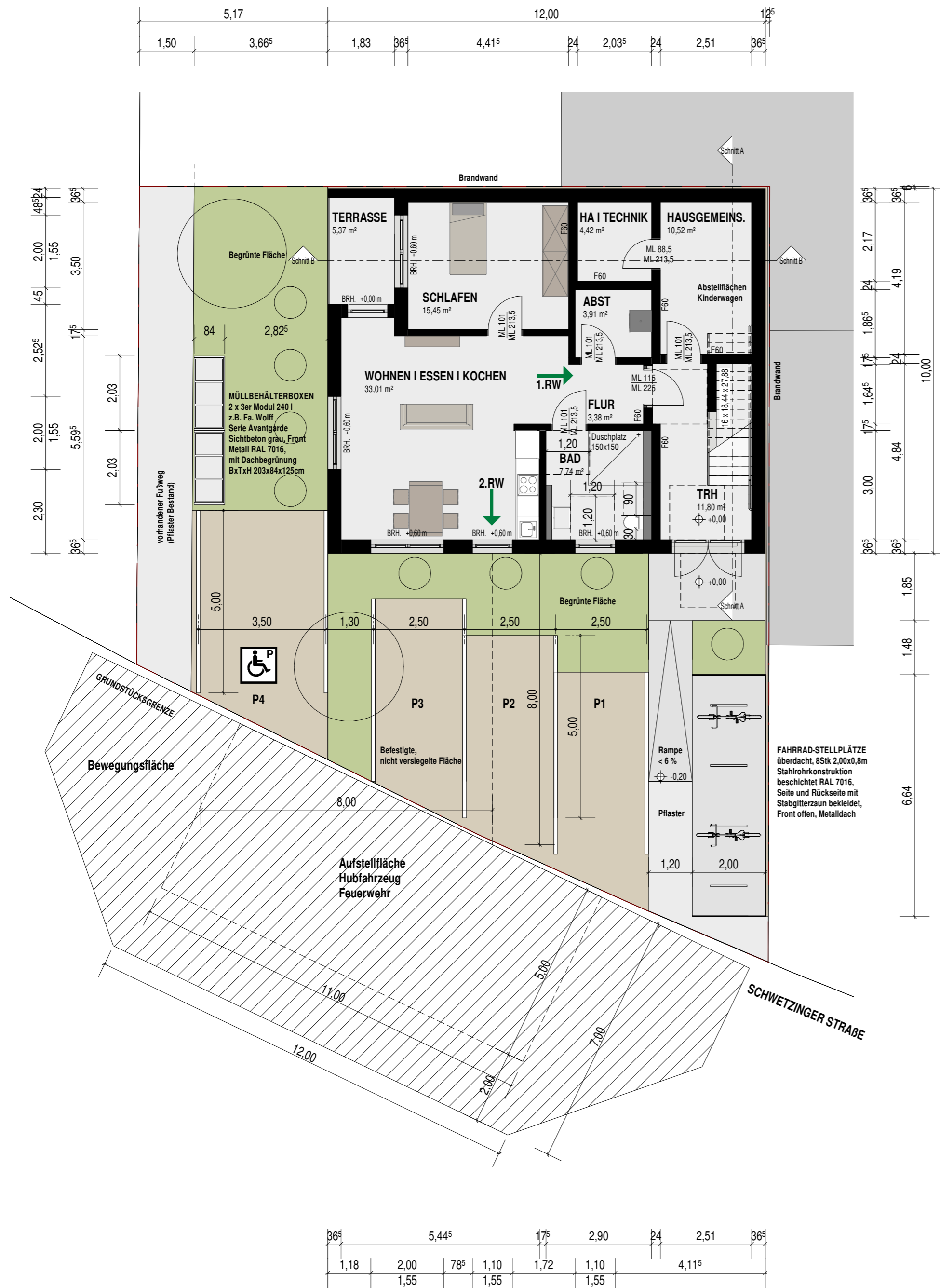
GRUNDRISS EG M 1:100

Grundstücksfläche = 300,34 m² = 300,00 m²