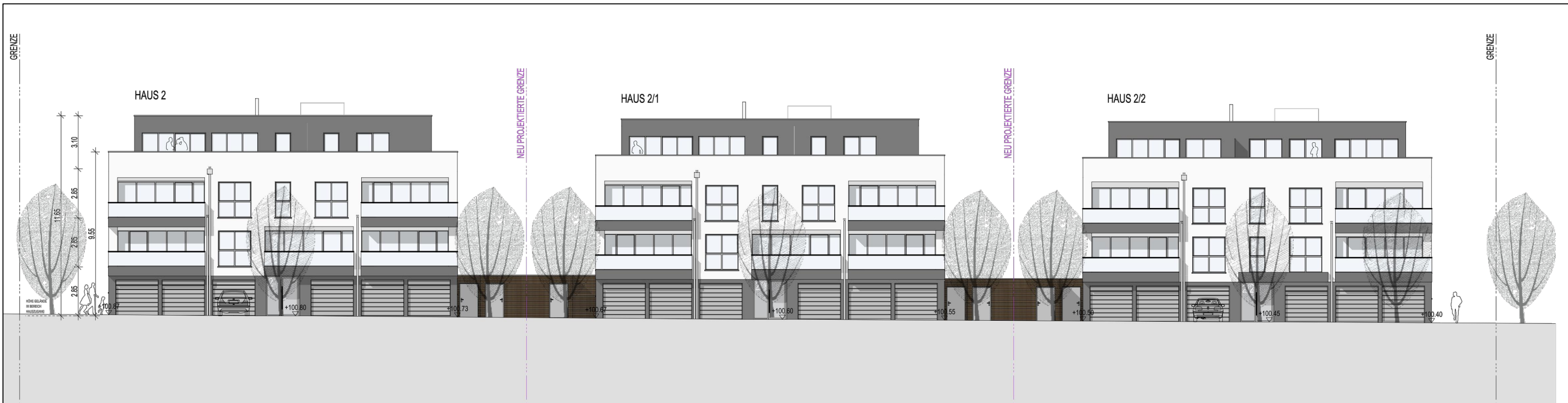
ANSICHT SÜDOST (KANTSTRASSE)